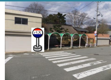
⑥七社バス停付近 箕谷行きバス停付近でお待ちください