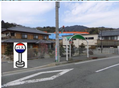
⑨福地バス停付近 箕谷行きバス停付近でお待ちください