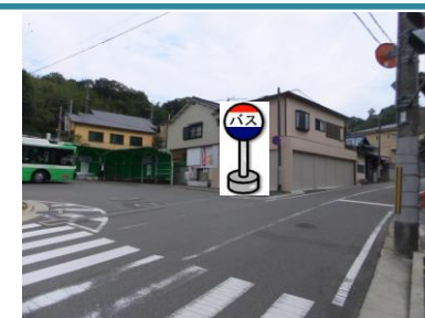
⑯箕谷駅 市バスのバス停角付近でお待ち下さい