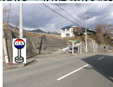
⑪蔵元バス停付近 箕谷行きバス停付近でお待ちください