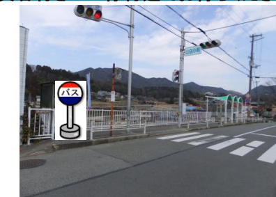
⑧山田小バス停付近 箕谷行きバス停付近でお待ちください