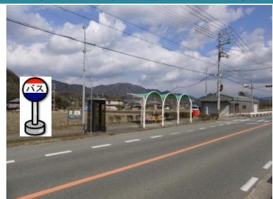
⑤丹生神社前バス停付近 箕谷行きバス停付近でお待ちください