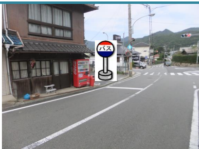
①箕谷駅 市バス停と反対側の信号前でお待ち下さい