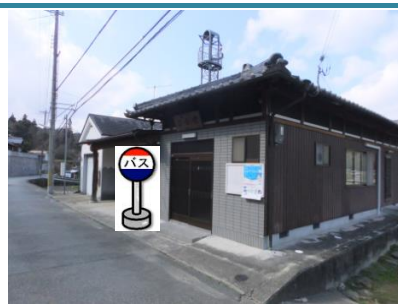
②西下公会堂 公会堂前でお待ちください