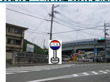
⑮小橋バス停付近 箕谷行き側バス停の少し手前でお待ち下さい