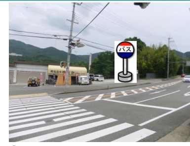
⑫ゆさか前 電柱辺りでお待ち下さい