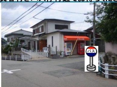
⑬青葉台米穀店前 店の向かい側の角でお待ち下さい