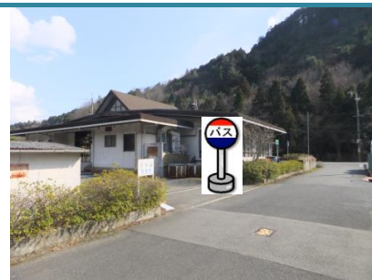
③衝原自然休養管理センター 施設の西側でお待ちください