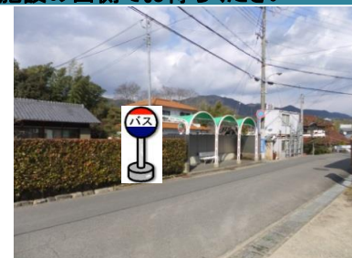
⑦東下バス停付近 箕谷行きバス停付近でお待ちください