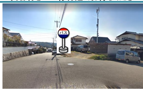
⑭三浦パール上駐車場付近 駐車場付近でお待ち下さい。