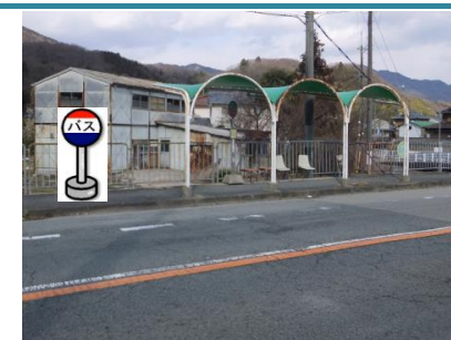
④坂本バス停付近 箕谷行きバス停付近でお待ちください