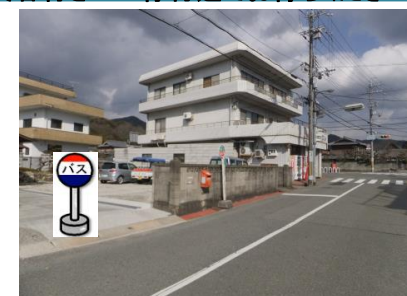
⑩谷寺口バス停付近 箕谷行きバス停付近でお待ちください