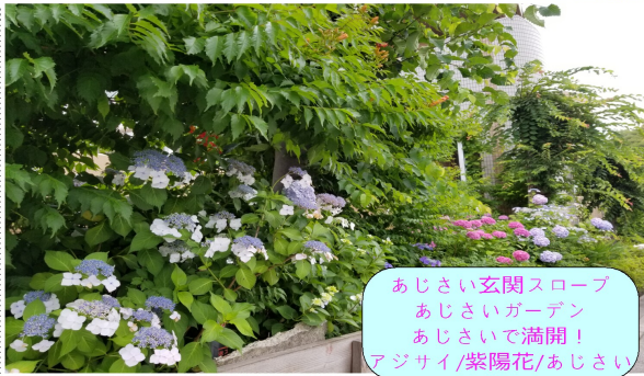
あじさい玄関スロープ あじさいガーデン あじさいで満開！ アジサイ/紫陽花/あじさい

緊急事態宣言解除を受けて、シルバーステイあじさいでは、面会禁止を一部解除しています。感染拡大を防止するために、最小限の面会にご協力ください。