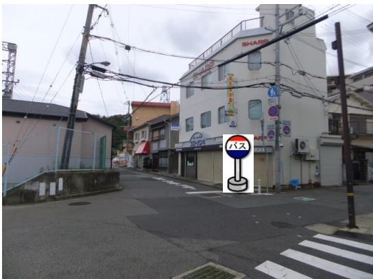
②山の街駅前・植戸電気前 植戸電気さんの入り口付近でお待ち下さい