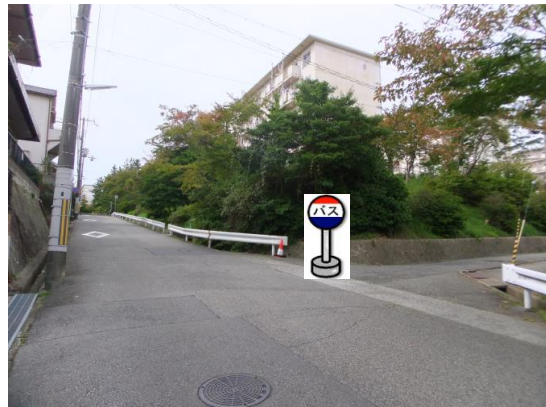
③市営桜の宮住宅1号棟前 1号棟の向い側、8号棟の角あたりでお待ち下さい