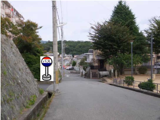
⑤出坂山公園 公園の反対側でお待ちください。