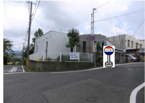
④市立桜の宮地域福祉センター前 福祉センター正面入り口付近でお待ち下さい