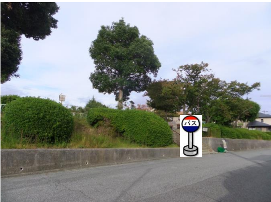
⑧若葉台公園前 公園南側入り口付近でお待ち下さい