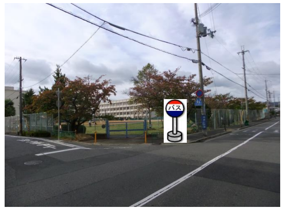
⑦市立桜の宮小学校(東南側) 小学校東南側の角でお待ち下さい