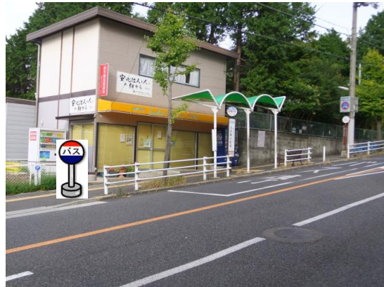
⑥北鈴蘭台駅前 中央病院行きバス停付近でお待ち下さい