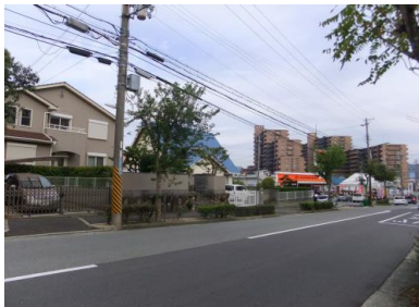
D- í →-% 7G^GG ö Ü3Æ HqHIHEH†HšHkHtHrHvH HwHyHjHpHbHnHmHlHkHjHiHhHgHfHeHdHcHbHaH