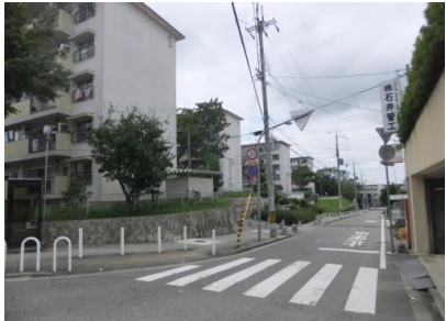
D#5e.R Ž" 5 K ... 5 • • GBGmGGGTGŠGEGuG • %3 È Ü3ÆF÷FÚ ...Fñ WF&FÔF¹