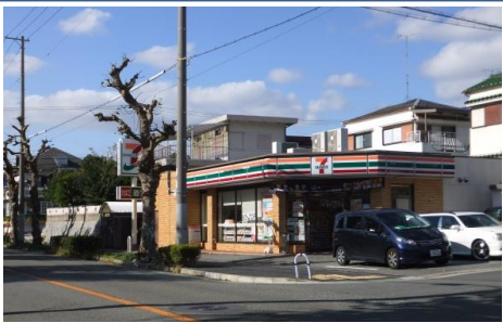
D GIGdG•G2GzGdG• S 9T34 Ü3ÆF÷FÚ ...Fñ WF&FÔF¹