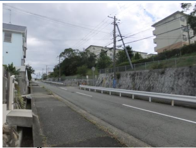
D 5e.R Ž" 5 K ..35 • • S 35 • • SFp o P F÷FÚ ...Fñ WF&FÔF¹