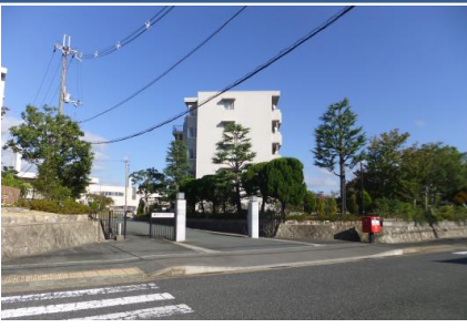
D(G FÖG FÖFp5 S !OY Fp °G • Ü3ÆF÷FÚ ...Fñ WF&FÔF¹